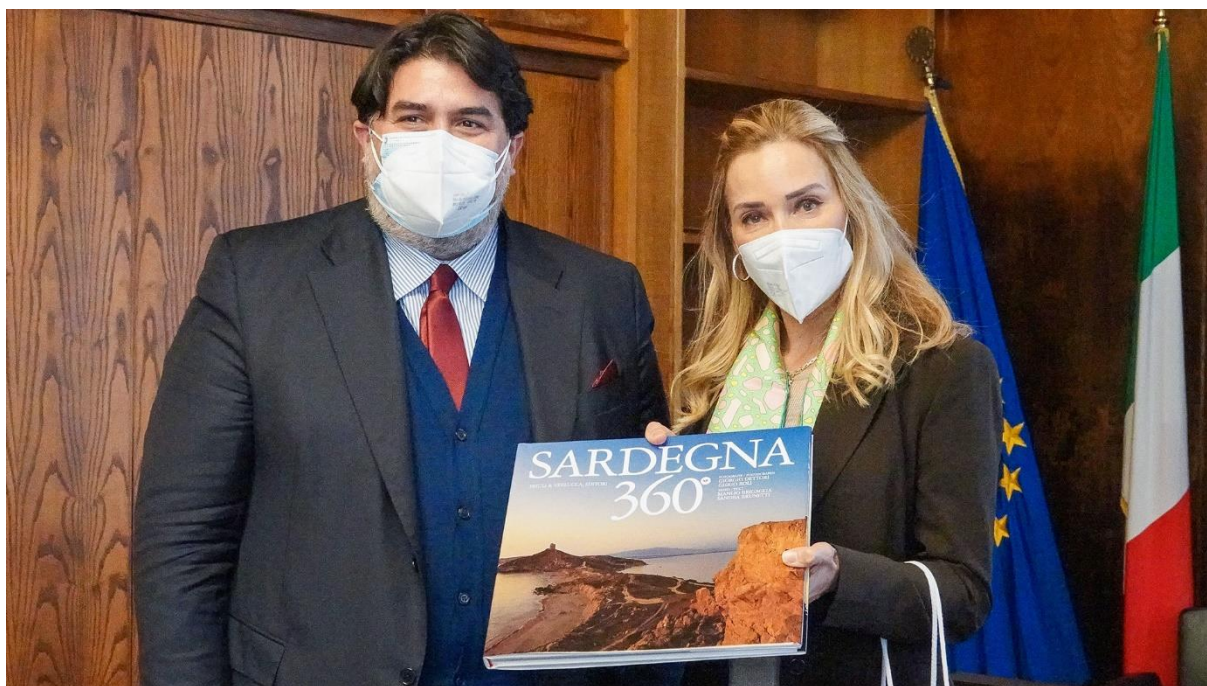
Pres. Solinas incontra Ambasciatrice della Svizzera

"C'è un'antica amicizia tra la nostra terra e la Svizzera - ha detto il presidente Solinas - rafforzata da comuni sentimenti e da un continuo scambio che perdura da decenni, e che ha visto la perfetta integrazione di molti Sardi in Svizzera, ove sono presenti 7 circoli di nostri conterranei, riuniti in una Federazione molto attiva, e di circa 800 cittadini svizzeri in Sardegna, terra che hanno scelto non solo per la sua bellezza e accoglienza, ma anche per lo sviluppo di numerose attività imprenditoriali".